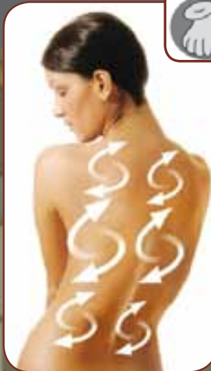
KNETEN / KNEADING

Rhythmisch starkes Kneten. Besonders zu empfehlen bei verspannten Muskeln. Rhythmical strong kneading-relaxation. Especially for relaxation of stiff muscles.