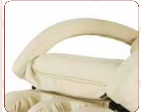
Armauflagen mit Komfort-Polsterung Armrests with comfort cushion