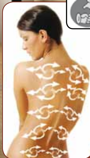
KNETEN / KNEADING