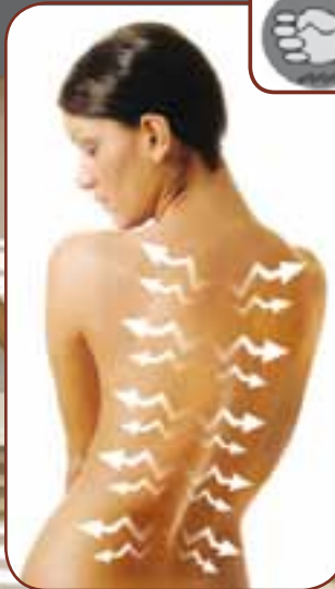
KLOPFEN / TAPPING

Angenehme Klopfbewegung einer Faust zur Entspannung der Muskeln. Feels like fists to eliminate feeling of stiff muscles.