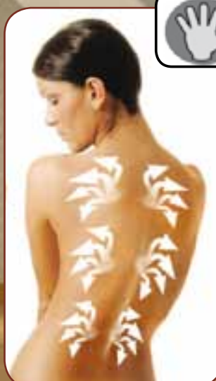
POCHEN / KNOCKING

Imitiert das stoßweise, periodische Pochen eines Masseurs mit seinen Handinnenseiten Imitates palms of massage doctors to hit stiff muscles intermittently.