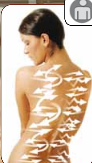
GANZKÖRPER / FULLBODY

Voll-Massage kombiniert mit Kneten, Klopfen, Drücken, Kneten + Klopfen und Pochen. Full course massage combining; kneading, tapping, pressing, kneading + tapping and knocking function.