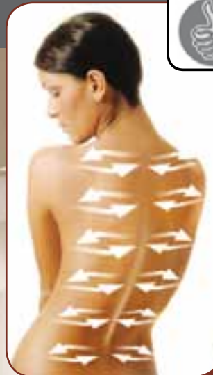
DRÜCKEN / PRESSING

Imitiert den Druck der Daumen eines professionellen Masseurs an bestimmten Stellen. Imitates thumbs of professional massage doctors to press on special points.