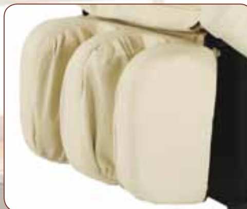
Gepolsterte Beinauflage mit Knet-Funktion. 8 Luftkissen sorgen für eine angenehme Wadenmassage.